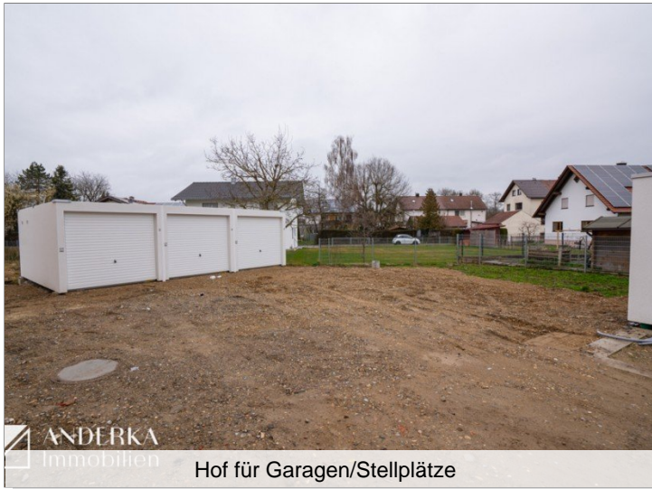
Hof für Garagen/Stellplätze