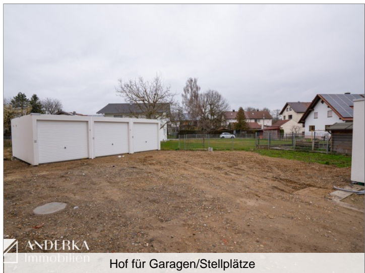
Hof für Garagen/Stellplätze