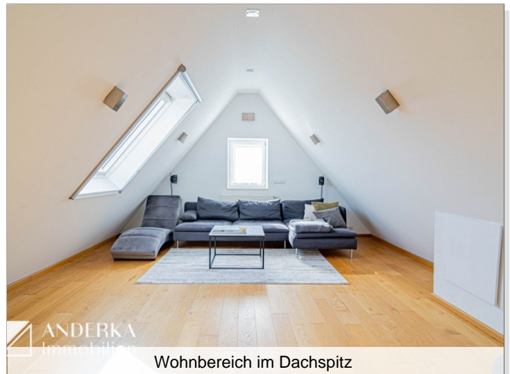
Wohnbereich im Dachspitz