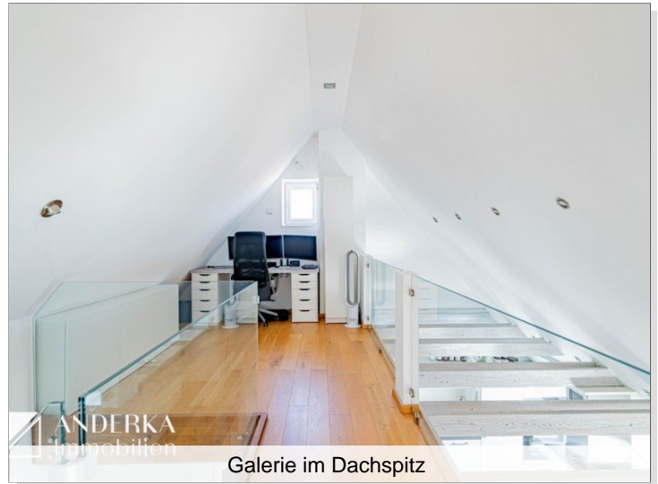
Galerie im Dachspitz