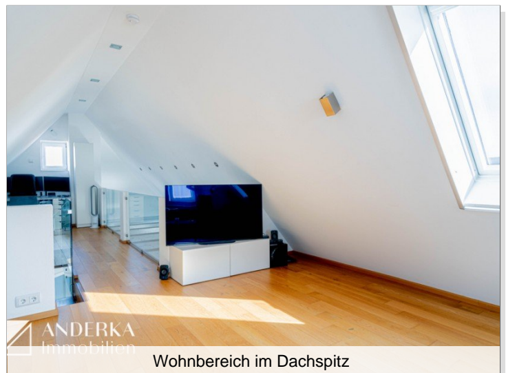
Wohnbereich im Dachspitz