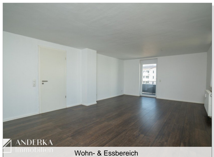
Wohn- & Essbereich