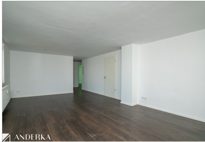
Wohn- & Essbereich