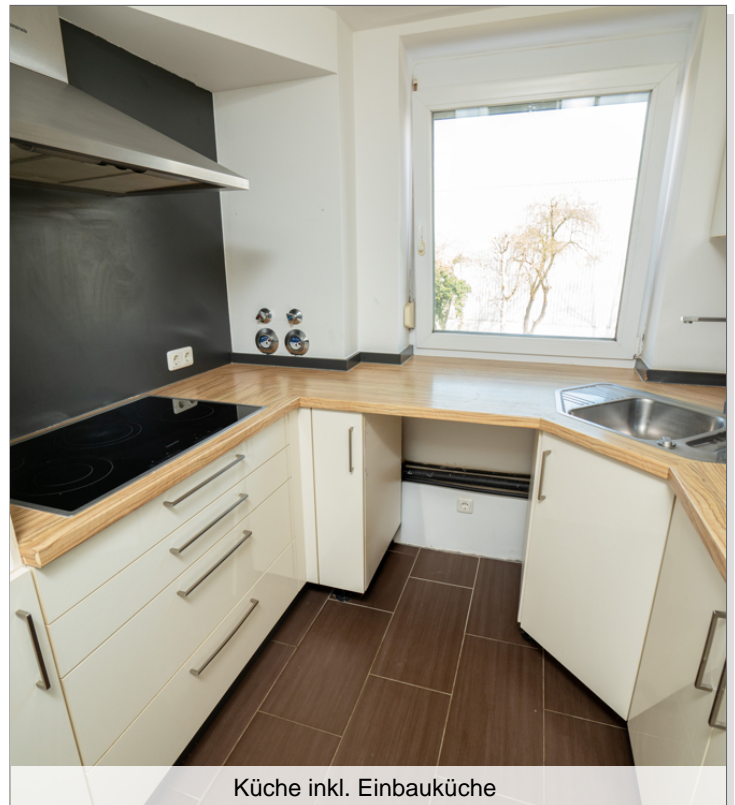
Küche inkl. Einbauküche