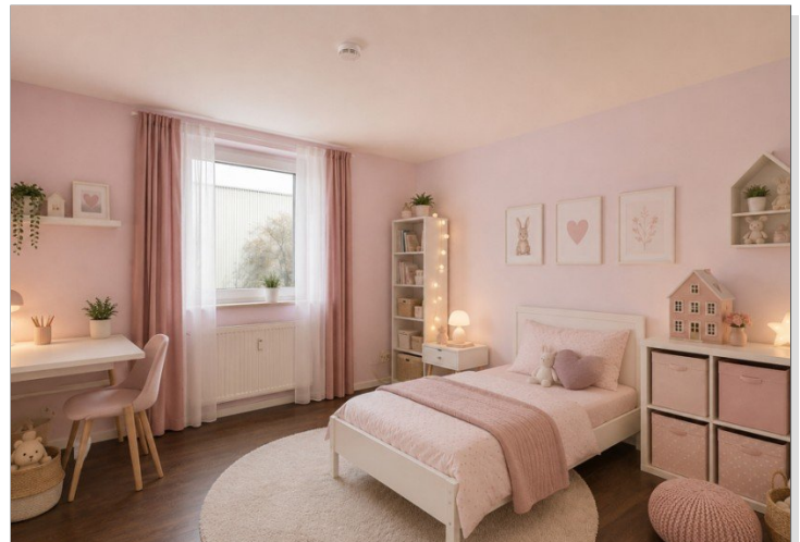
KI - Visualisierung