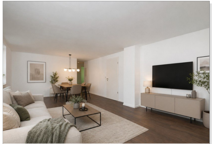
KI - Visualisierung