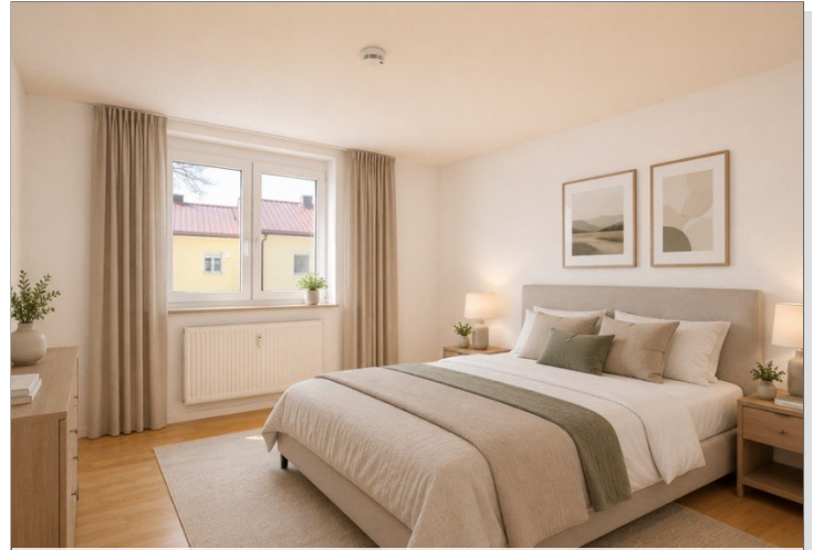
KI - Visualisierung