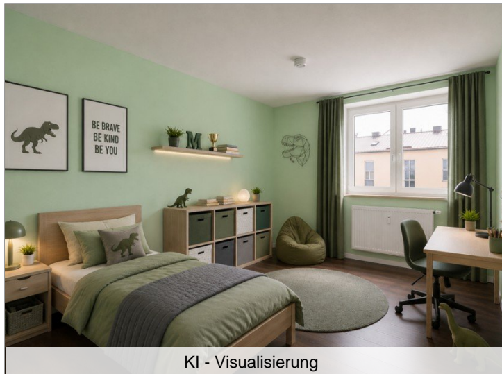
KI - Visualisierung