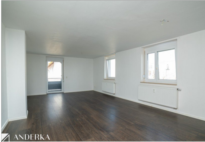
Wohn- & Essbereich