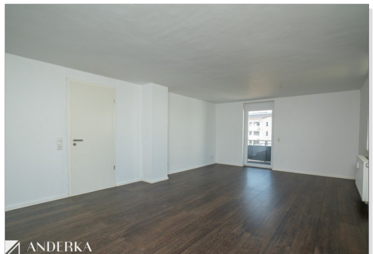
Wohn- & Essbereich