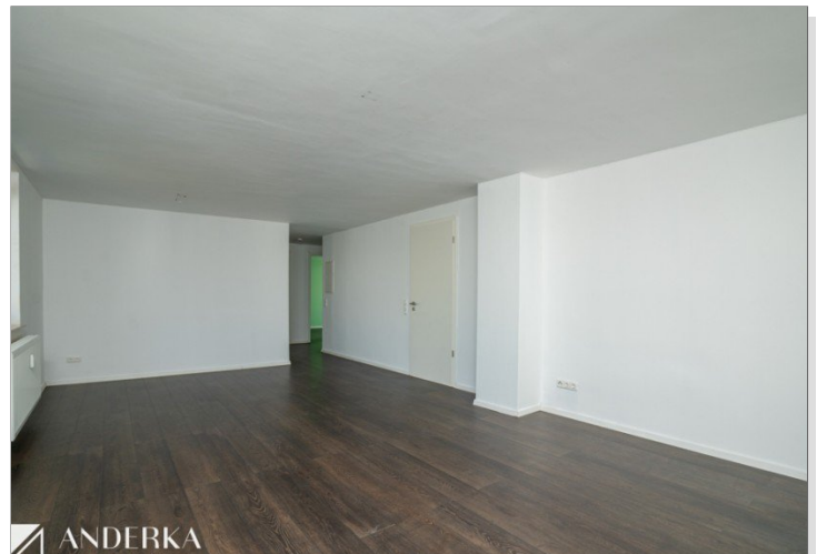
Wohn- & Essbereich