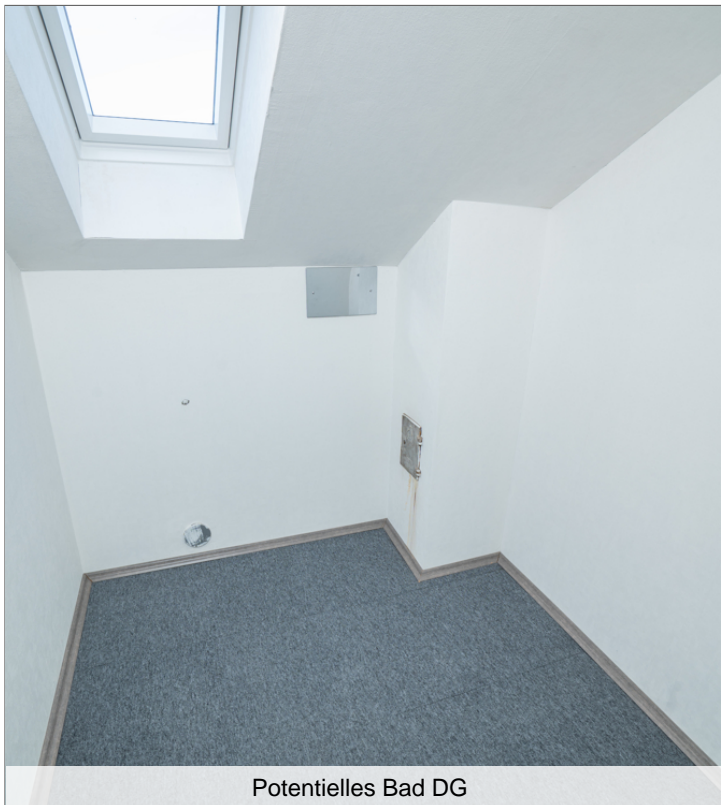
Potentielles Bad DG