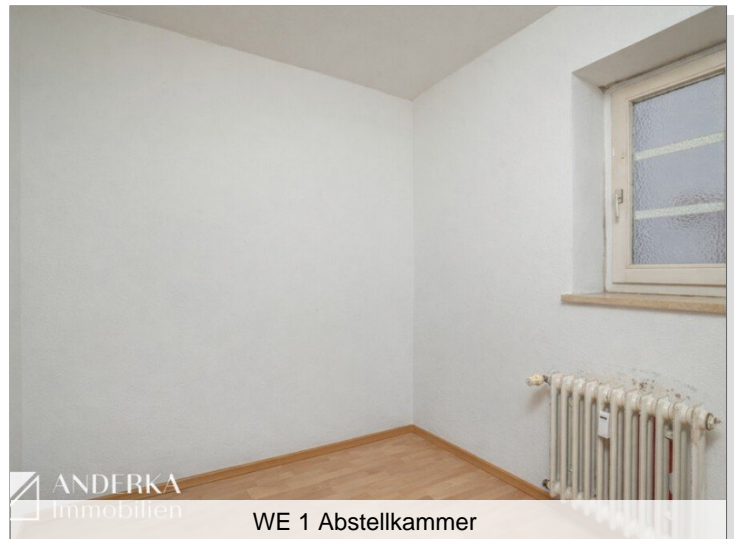
WE 1 Abstellkammer