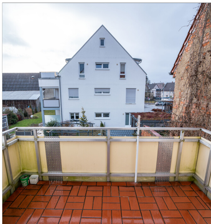
WE 2 Balkon Gästezimmer