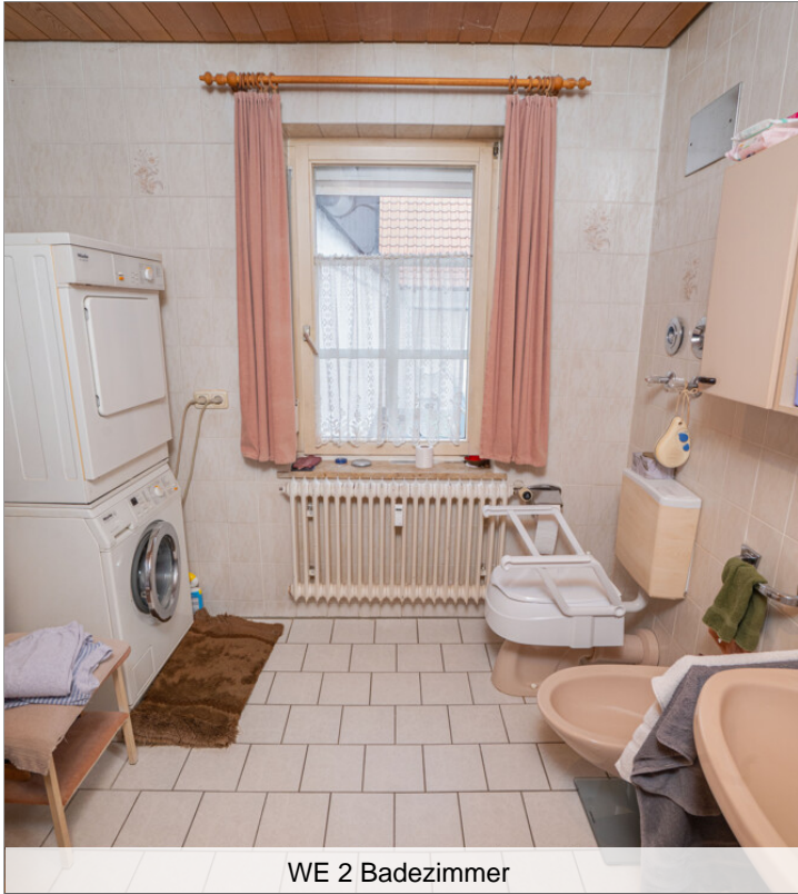
WE 2 Badezimmer