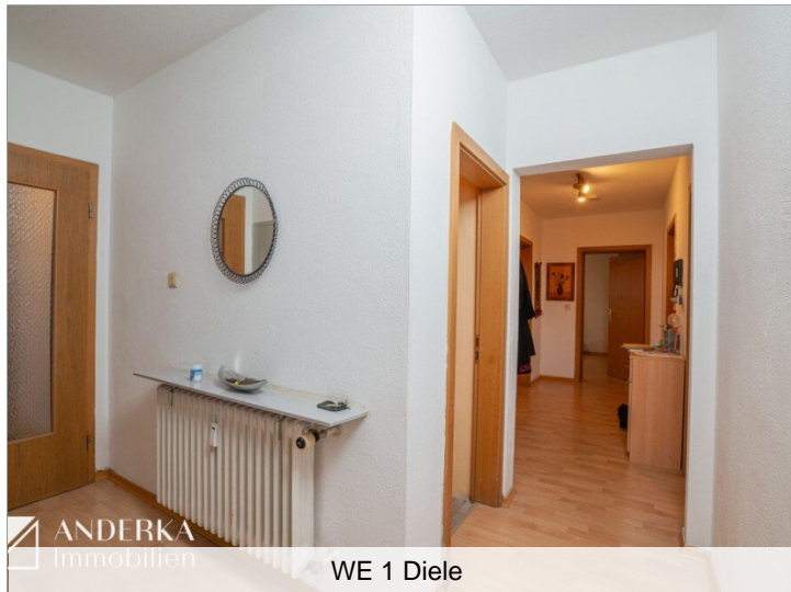
WE 1 Diele