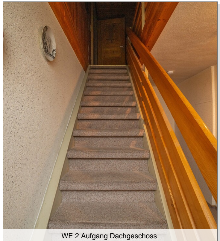
WE 2 Aufgang Dachgeschoss