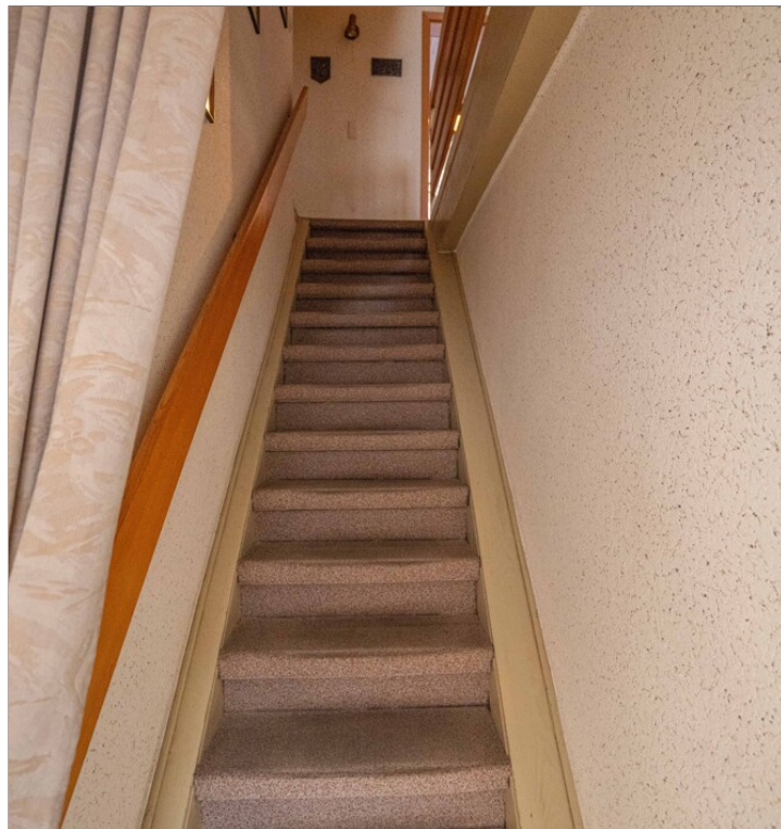
WE 2 Treppenaufgang