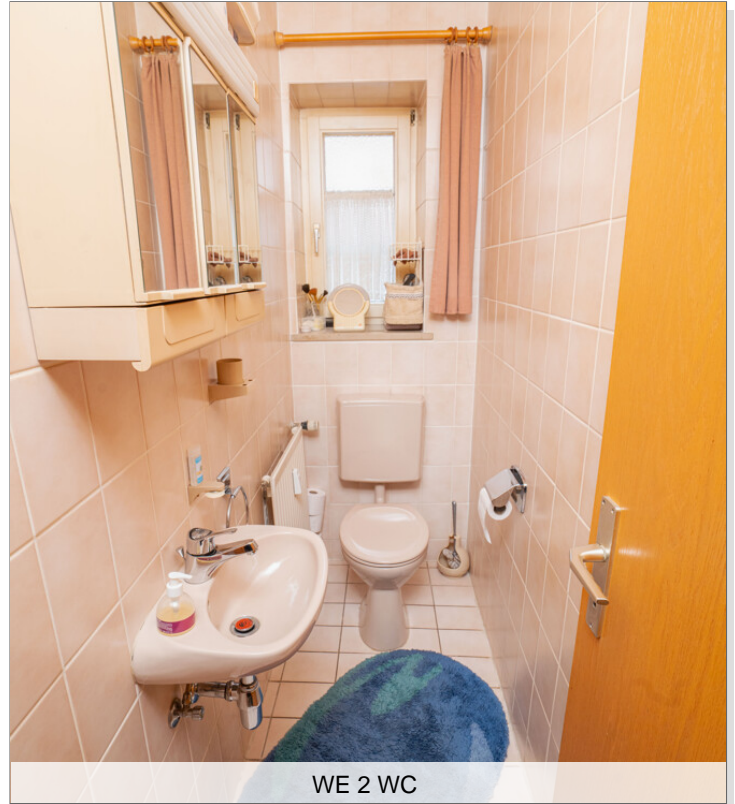
WE 2 WC