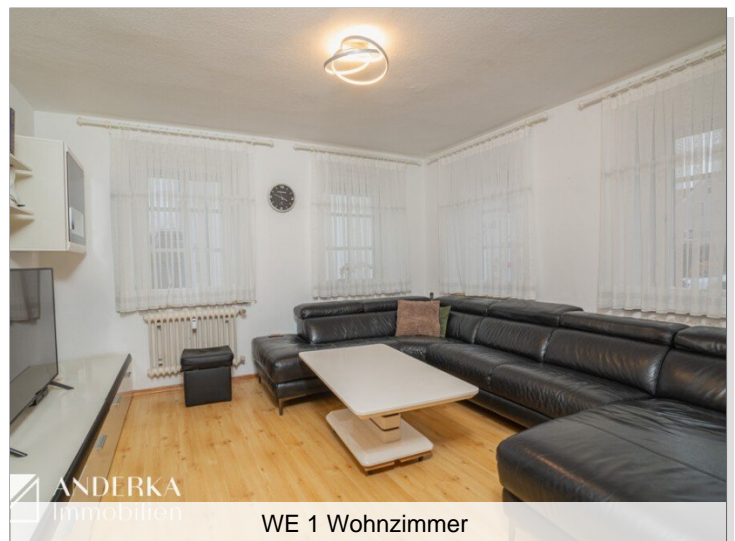
WE 1 Wohnzimmer