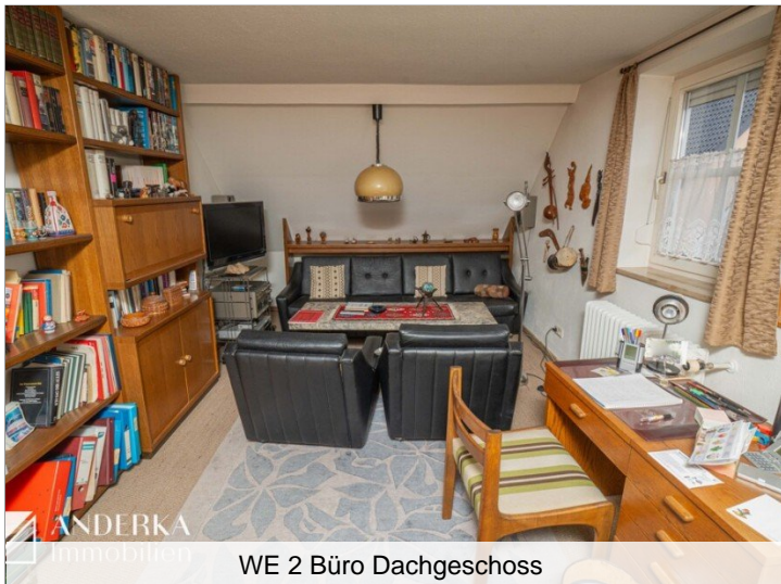
WE 2 Büro Dachgeschoss