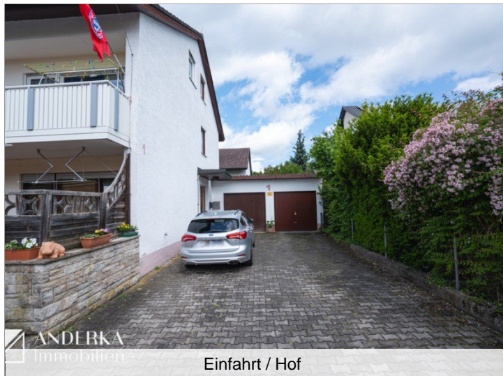
Einfahrt / Hof