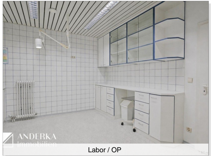
Labor / OP