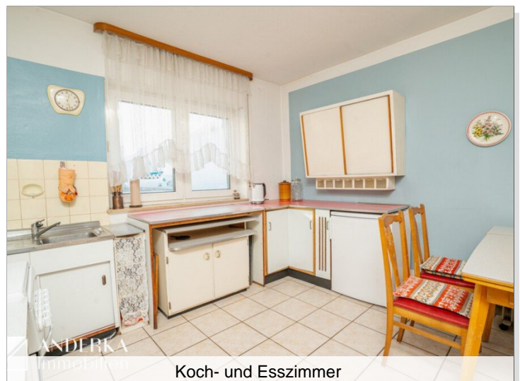
Koch- und Esszimmer