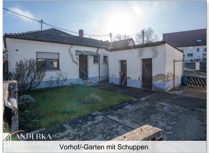
Vorhof/-Garten mit Schuppen