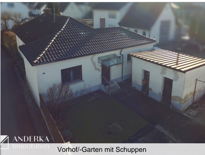
Vorhof/-Garten mit Schuppen