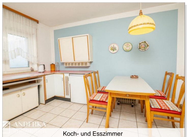
Koch- und Esszimmer