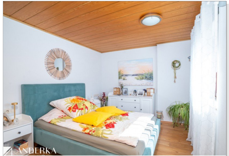
Schlafzimmer / Ankleide OG