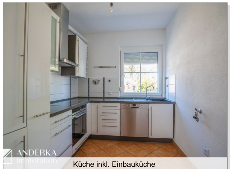
Küche inkl. Einbauküche