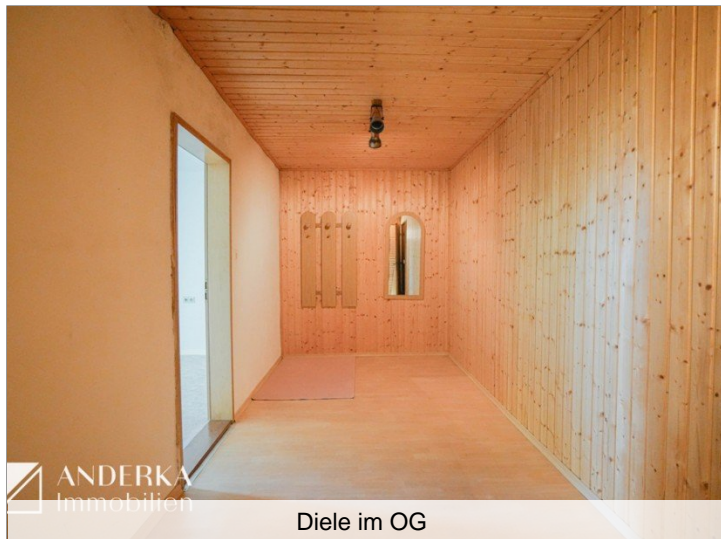
Diele im OG