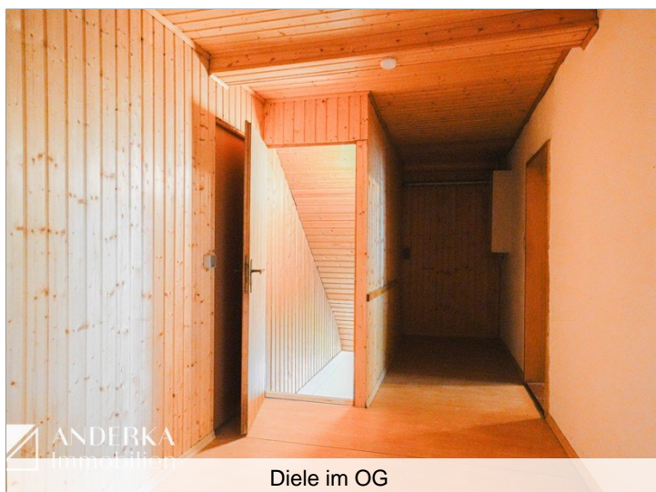
Diele im OG