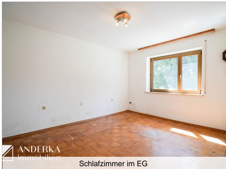
Schlafzimmer im EG