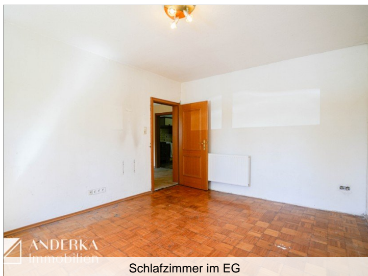
Schlafzimmer im EG