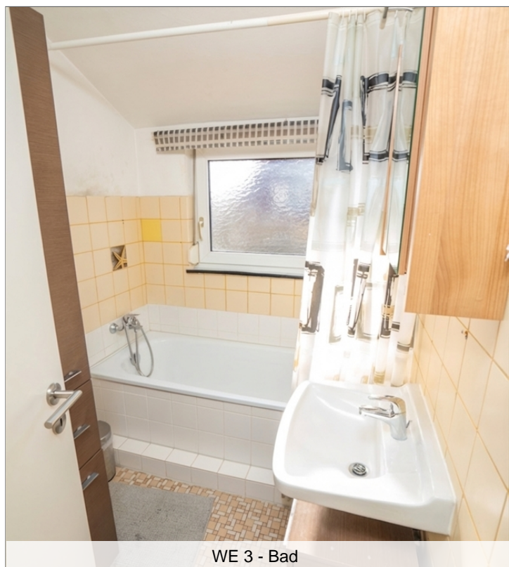
WE 3 - Bad