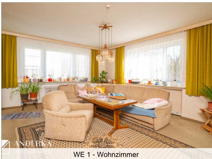
WE 1 - Wohnzimmer