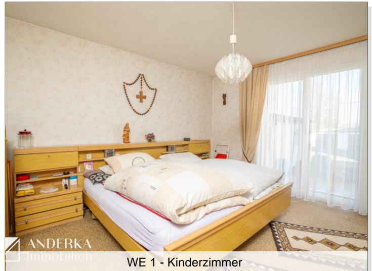
WE 1 - Kinderzimmer