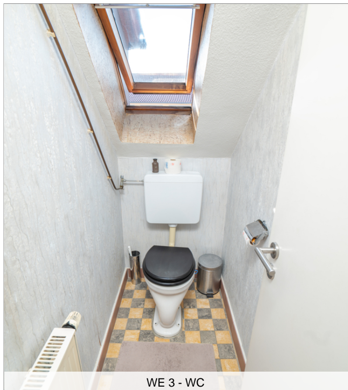
WE 3 - WC