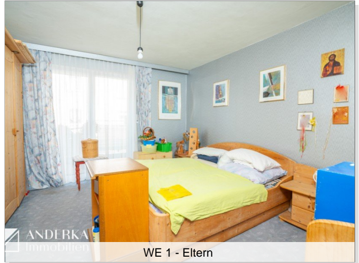
WE 1 - Eltern