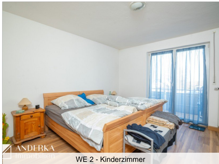
WE 2 - Kinderzimmer