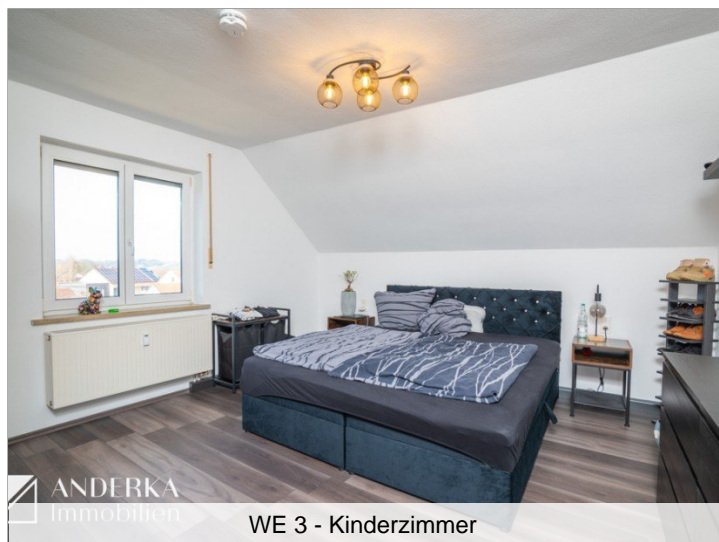
WE 3 - Kinderzimmer