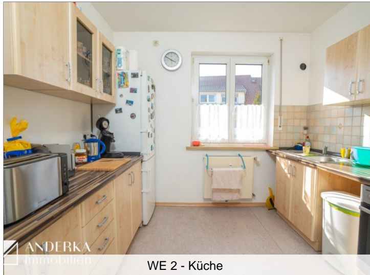
WE 2 - Küche