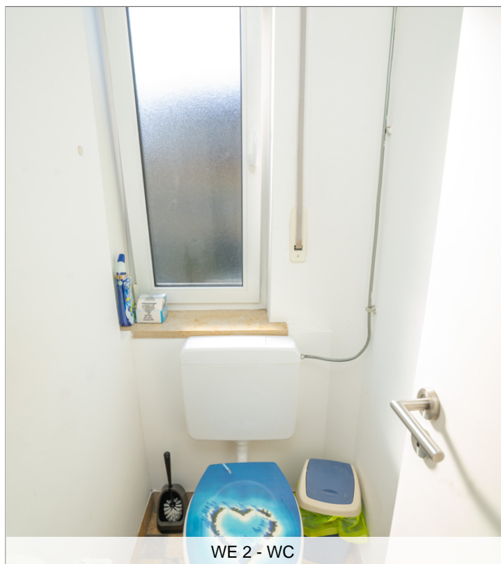
WE 2 - WC