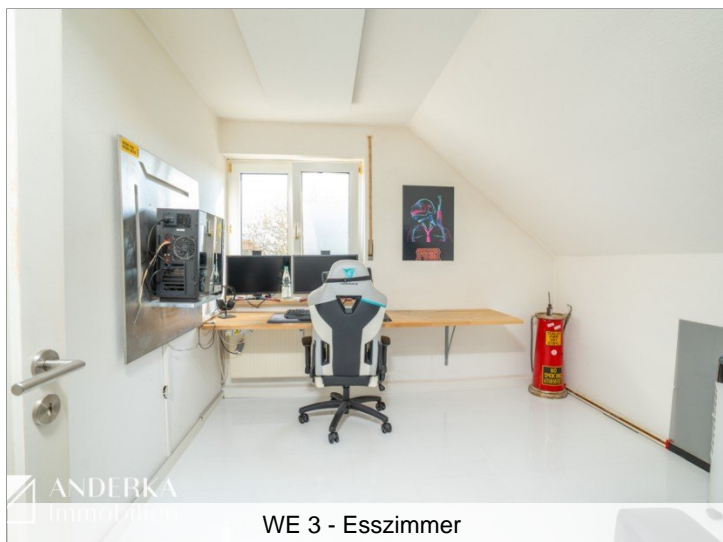
WE 3 - Esszimmer