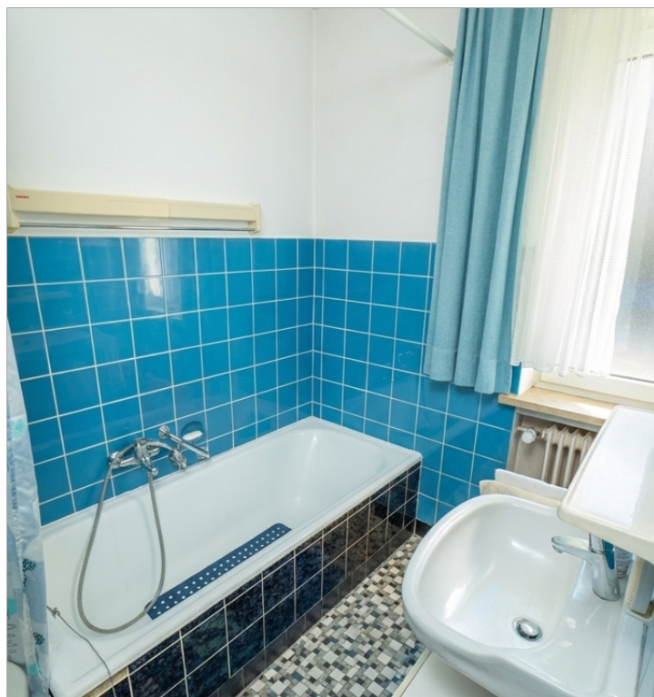
WE 1 - Bad