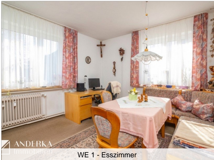
WE 1 - Esszimmer