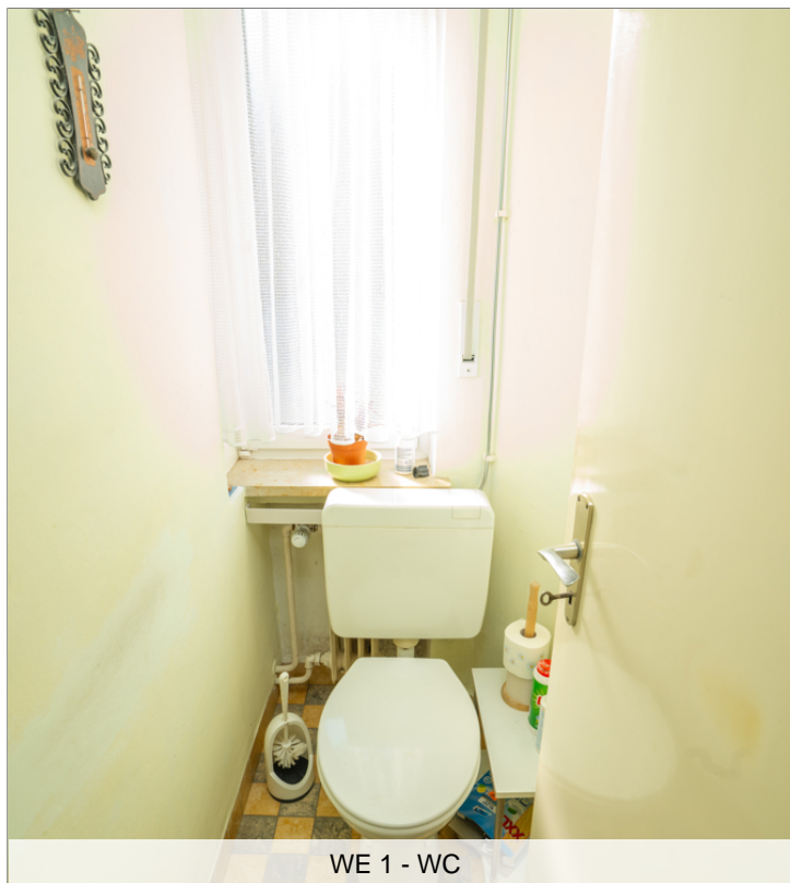
WE 1 - WC