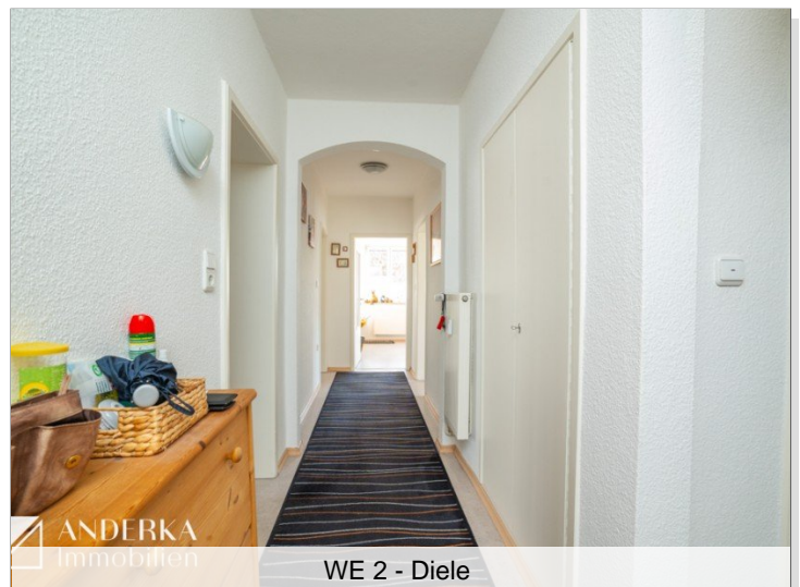
WE 2 - Diele