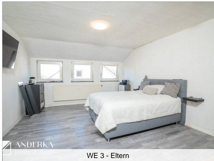
WE 3 - Eltern