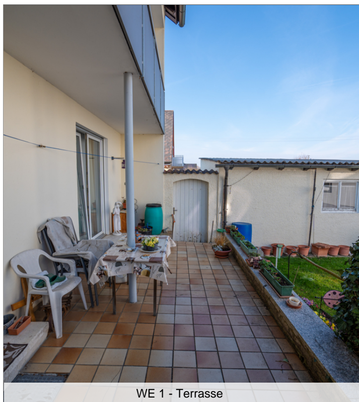
WE 1 - Terrasse