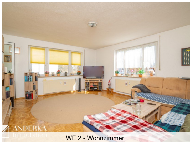
WE 2 - Wohnzimmer