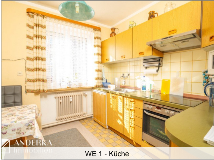
WE 1 - Küche