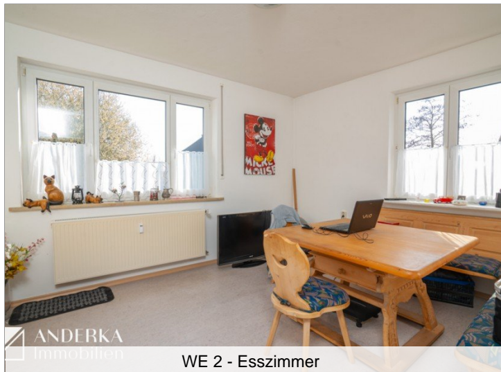
WE 2 - Esszimmer