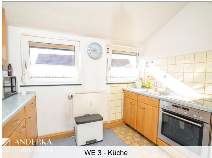
WE 3 - Küche