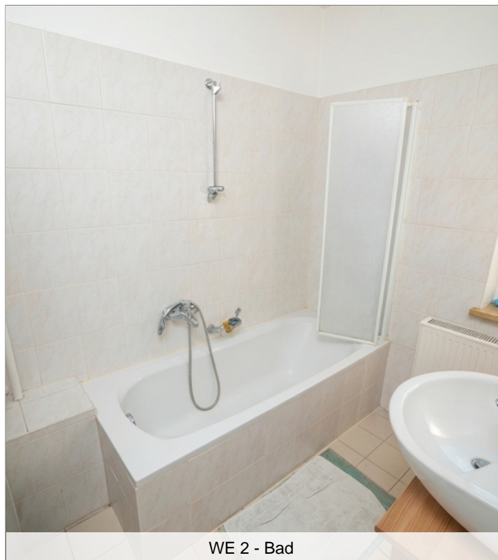
WE 2 - Bad