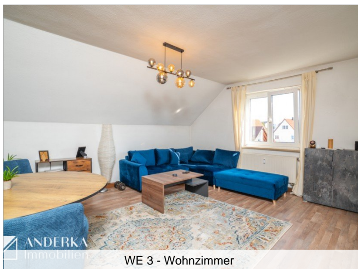
WE 3 - Wohnzimmer