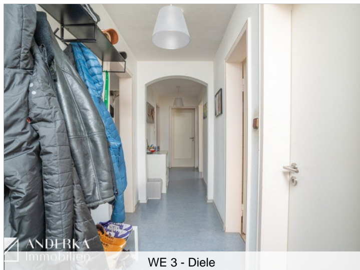
WE 3 - Diele