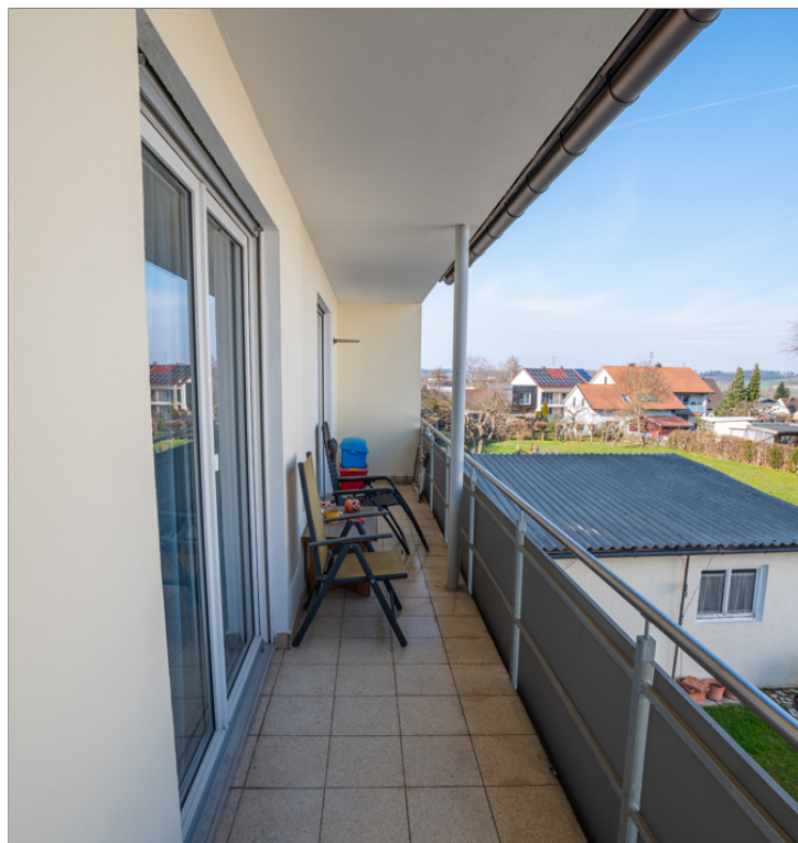
WE 2 - Balkon