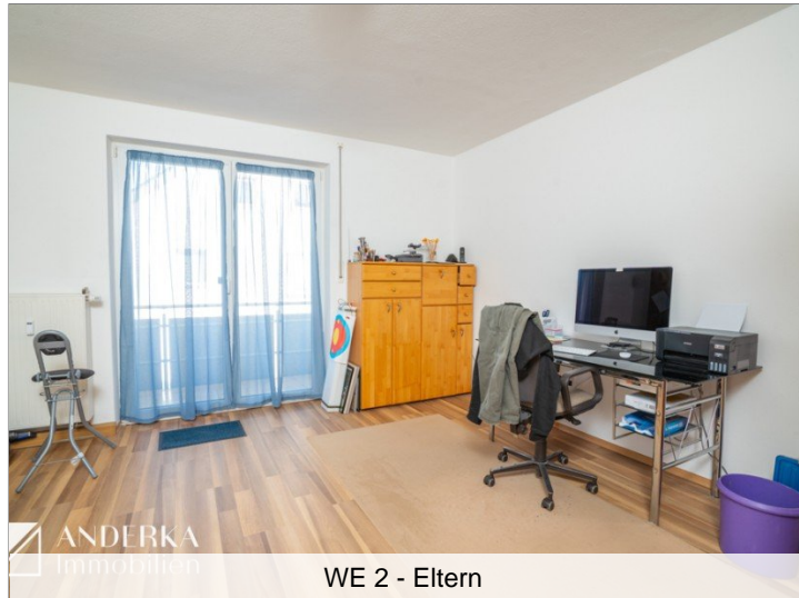
WE 2 - Eltern