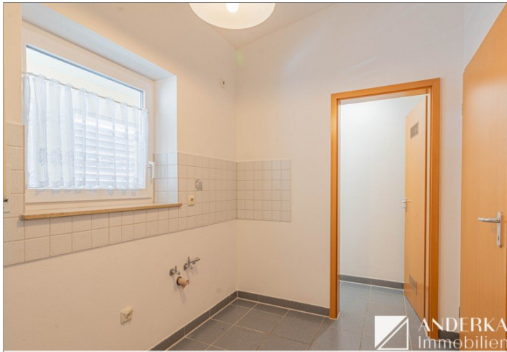
Küche mit Speisekammer