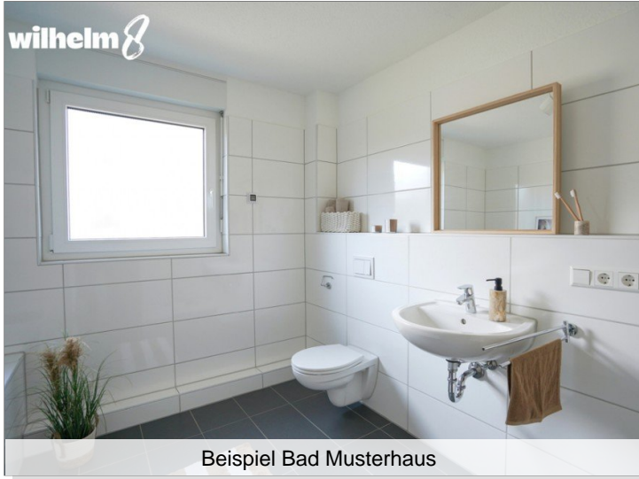
Beispiel Bad Musterhaus