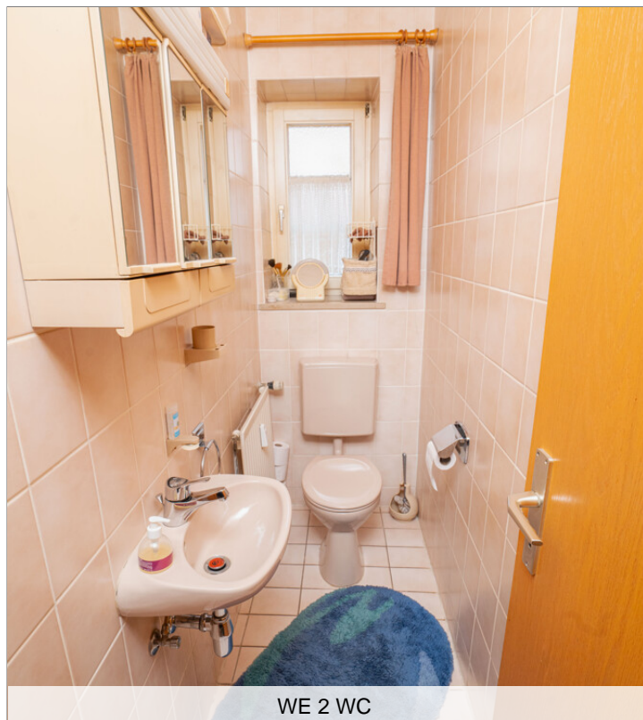
WE 2 WC