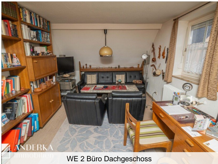
WE 2 Büro Dachgeschoss