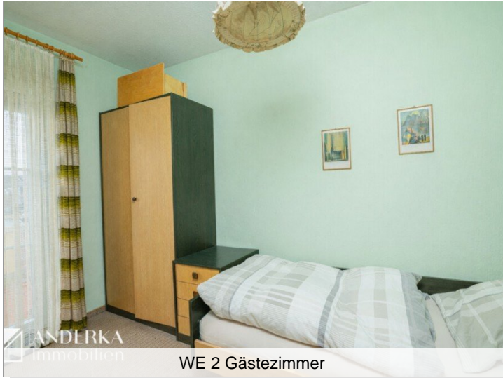
WE 2 Gästezimmer