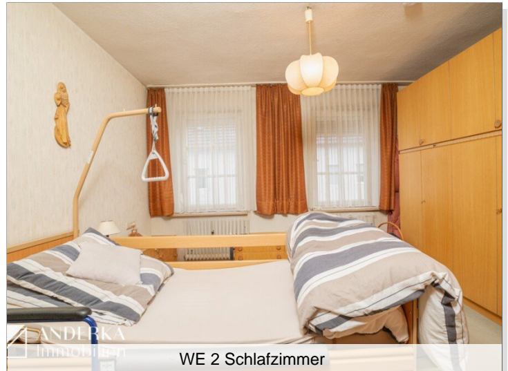
WE 2 Schlafzimmer