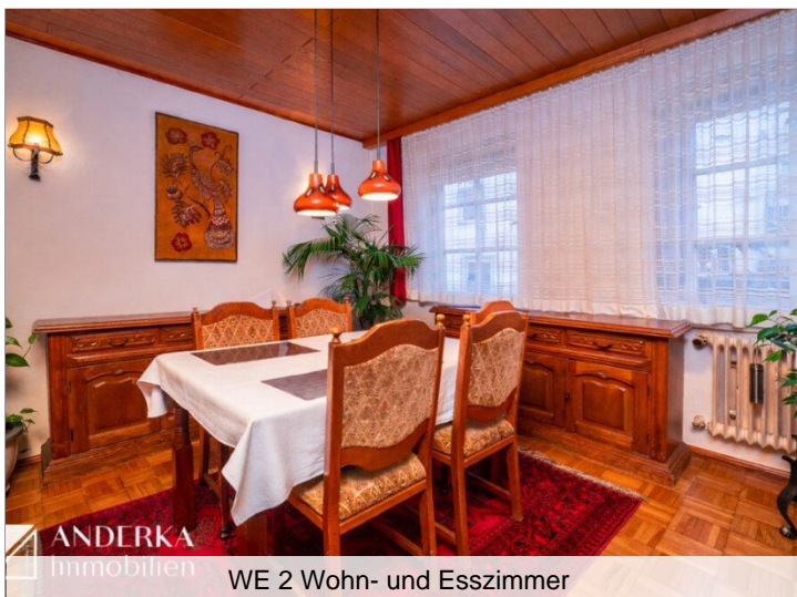
WE 2 Wohn- und Esszimmer