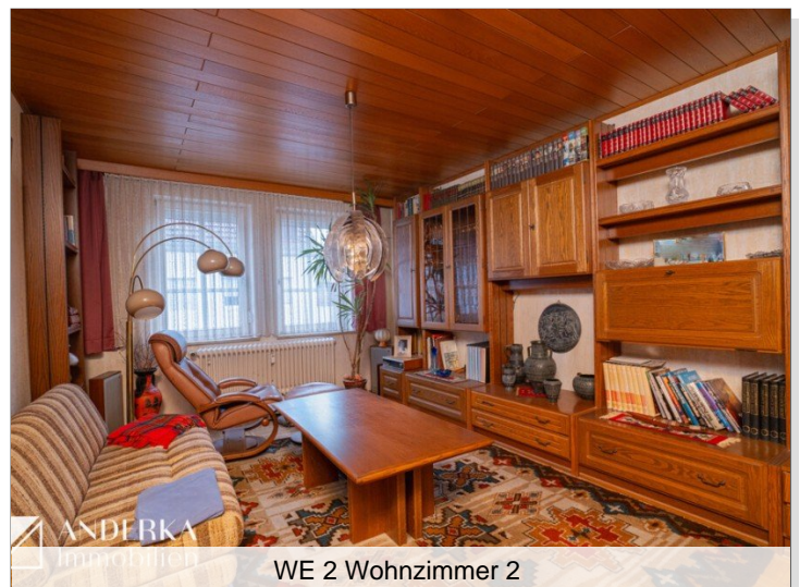
WE 2 Wohnzimmer 2