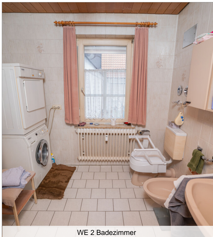
WE 2 Badezimmer