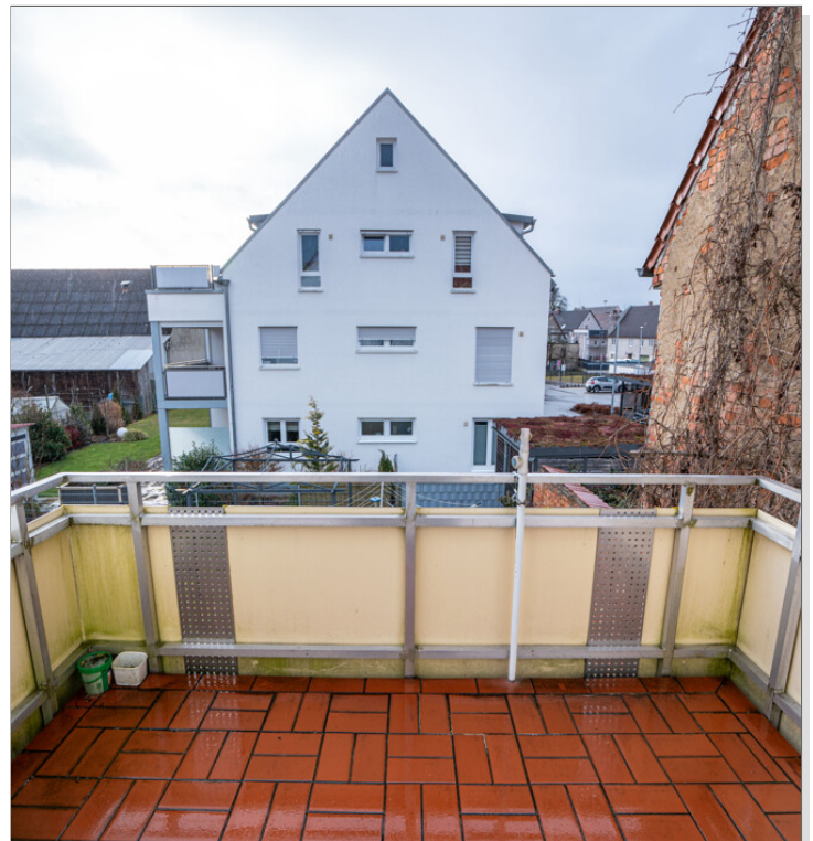
WE 2 Balkon Gästezimmer