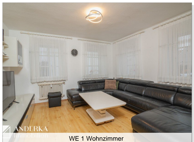
WE 1 Wohnzimmer