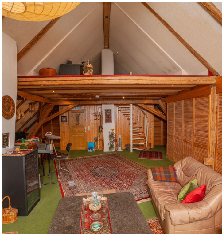
WE 2 Ausgebautes Dachgeschoss