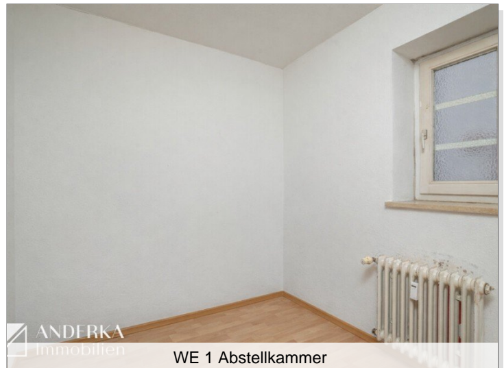
WE 1 Abstellkammer