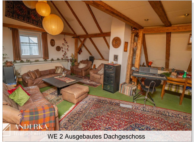
WE 2 Ausgebautes Dachgeschoss