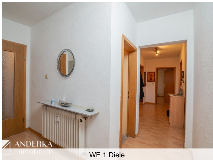
WE 1 Diele