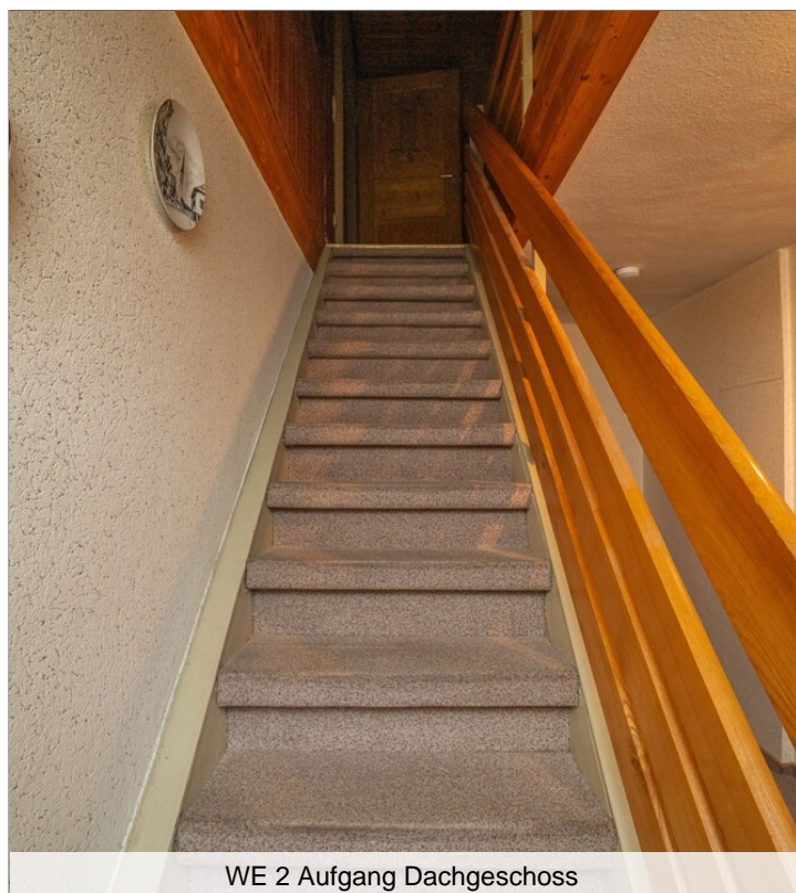
WE 2 Aufgang Dachgeschoss