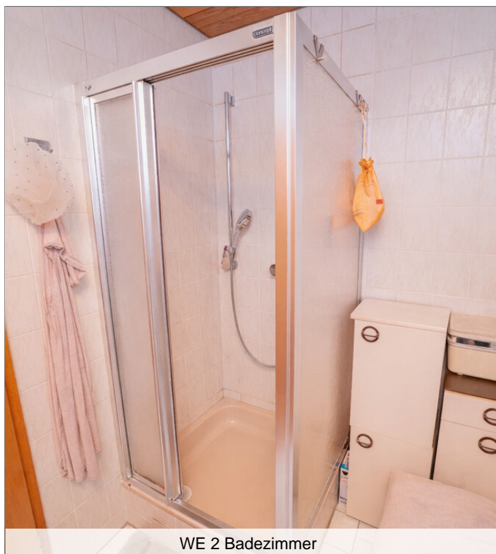
WE 2 Badezimmer