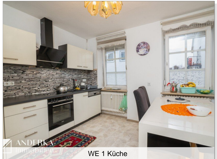
WE 1 Küche