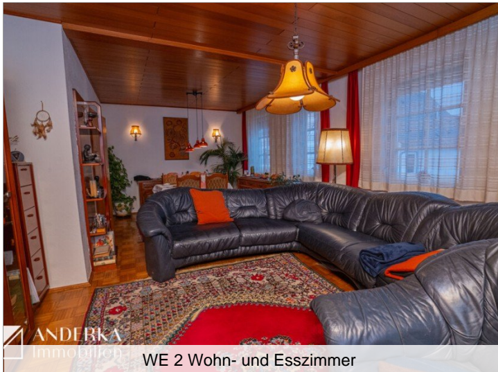
WE 2 Wohn- und Esszimmer