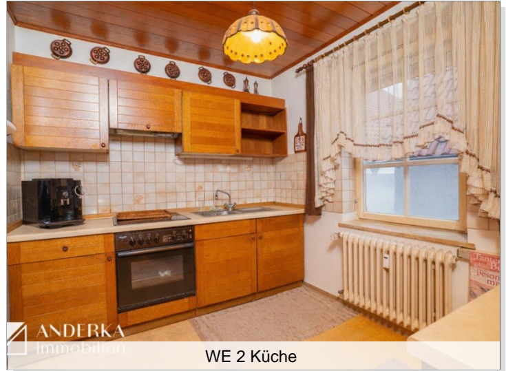
WE 2 Küche