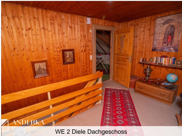
WE 2 Diele Dachgeschoss