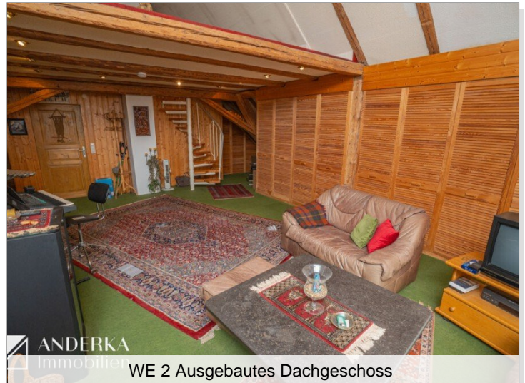
WE 2 Ausgebautes Dachgeschoss