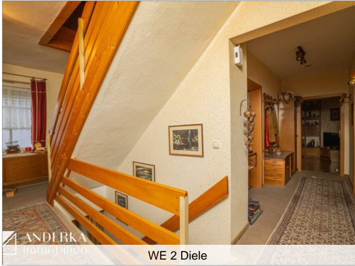
WE 2 Diele