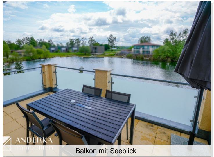
Balkon mit Seeblick