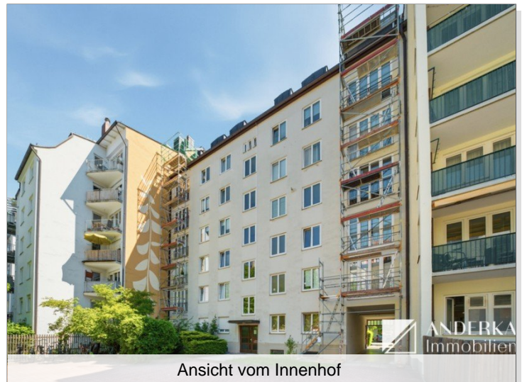
Ansicht vom Innenhof