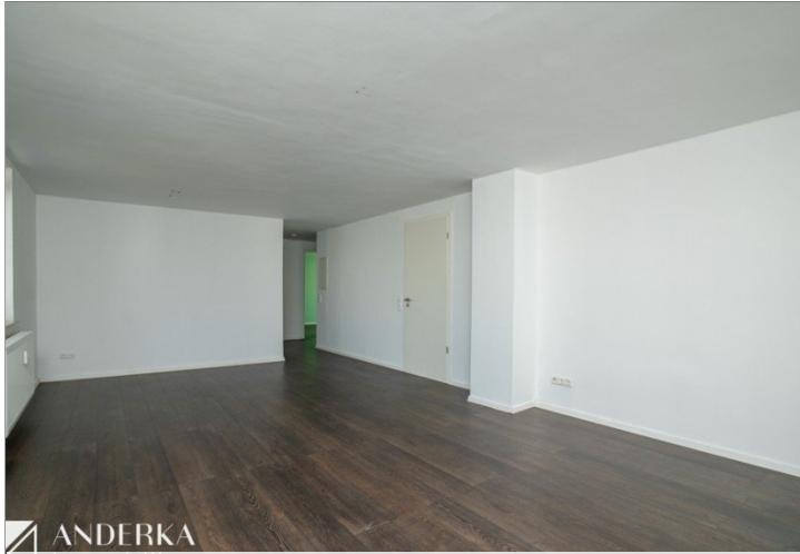
Wohn- & Essbereich