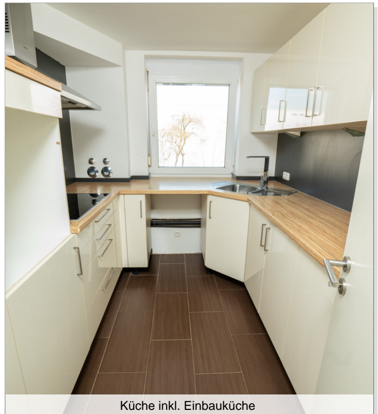
Küche inkl. Einbauküche