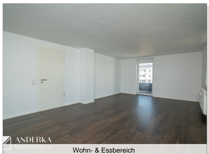
Wohn- & Essbereich