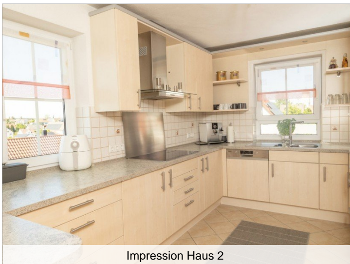
Impression Haus 2