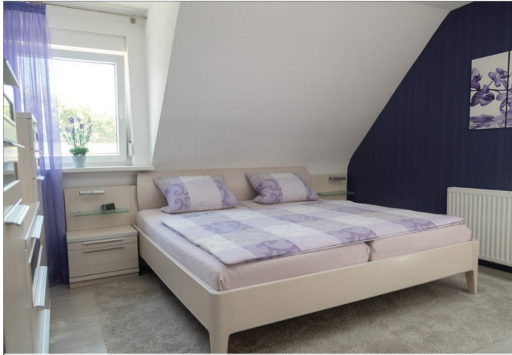
Impression Haus 1