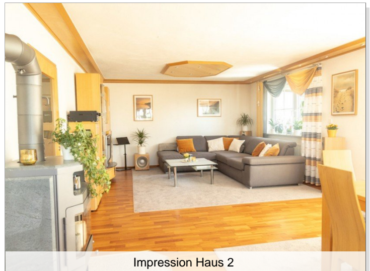
Impression Haus 2