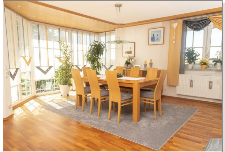
Impression Haus 2