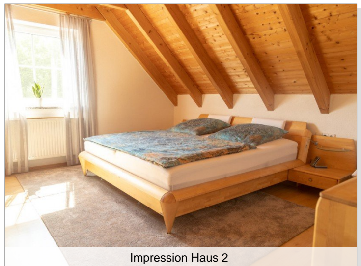
Impression Haus 2